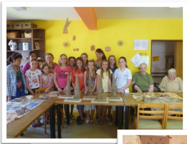
Spolupráce s II. ZŠ