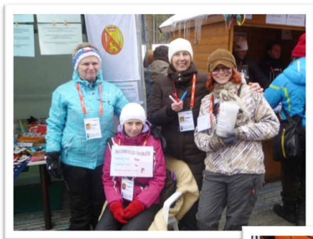
Prezentace NSS spojená s prodejem výrobků na Biatlon