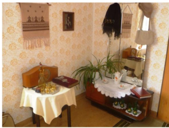
Vybudování reminiscenčního koutku