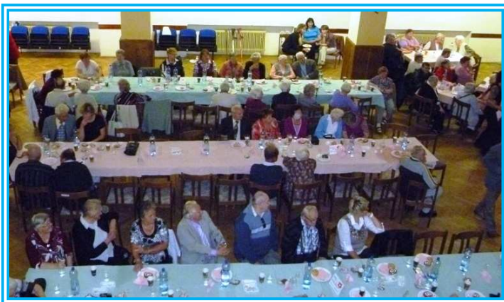
Setkání seniorů ve Velkém Meziříčí

V letošním roce jsme navázali na tradici a opět pořádali Setkání seniorů , které se tentokrát uskutečnilo 6. 6. 2012 ve Velkém Meziříčí.