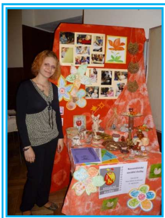
Prezentace naší organizace