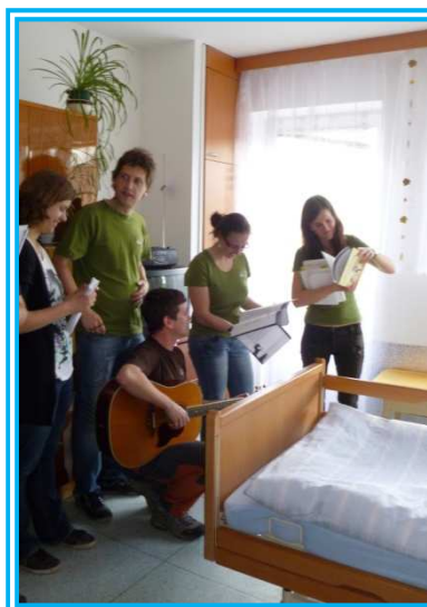
Zpěv skautů uživatelům