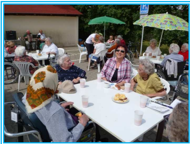
Kavárnička na parkovišti DPS

V rámci oslav Nova Civitas měli ve dnech 22. – 23. 6. Novoměstské sociální služby svůj program. Nejprve proběhla kavárnička na parkovišti DPS, kde nám zahráli muzikanti z Třebíče, posléze jsme se prezentovali na Vratislavově náměstí a to konkrétně veřejnou sbírkou. Celý program byl spojen i s Dnem otevřených dveří DPS.