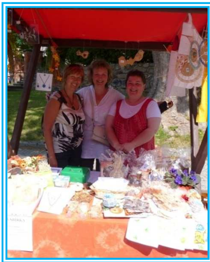
Veřejná sbírka na Vratislavově náměstí